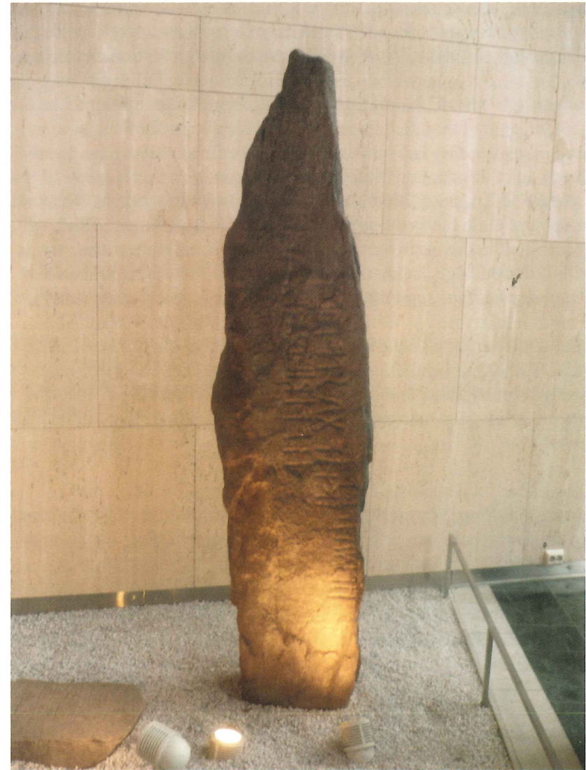
Runesteinen fra Kjøløvik, Strand i Ryfylke, Rogaland (ca. 400-500 e.v.t.), står på Universitetet i Oslo. Oversatt til moderne norsk står det «Jeg Hagustad gravla sønnen min».