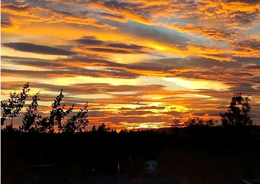
Solnedgang Nordbyhagen.