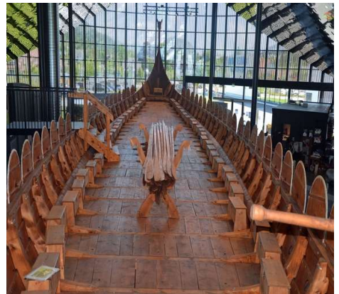
Innsiden av Myklebustskippet (Fra Wikipedia)

Velkommen til Sagastad – velkommen til vikingtida og blot!