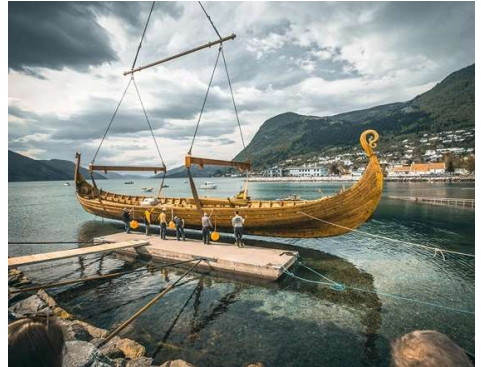
Sjøsetting av Myklebustskipet

Myklebustskipet, med sin imponerende størrelse, viser vikingtidens avanserte design og skipsbyggingsteknikker.