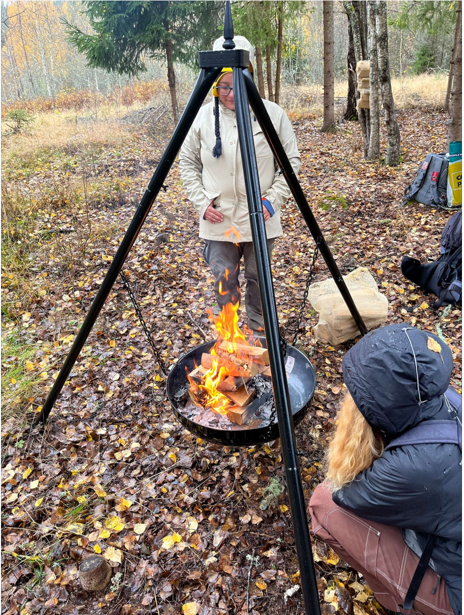
Høstblotet 2025 i Nes.