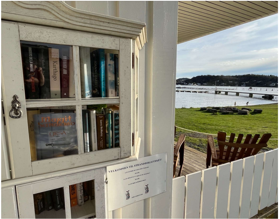
Strandbibliotek på Solløkkka.