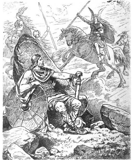
Helge Hundingsbane av Johannes Gherts (Wikipedia)