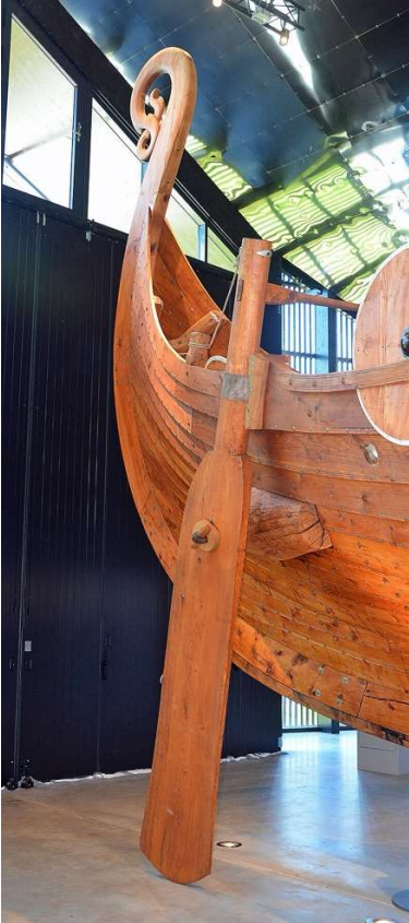
Nærbilde av akterskip