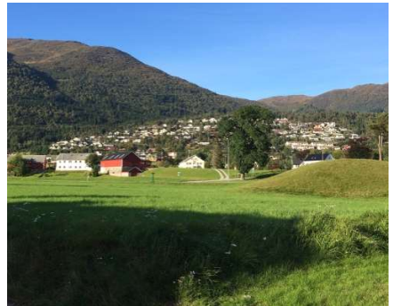
Gravhaugen på gården Myklebust, i Nordfjordeid