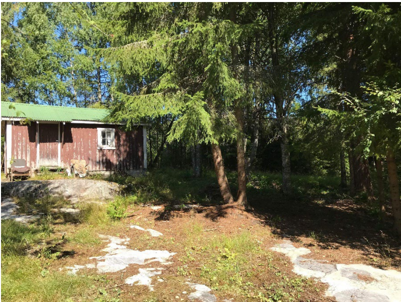
Vår nye tomt i Nes.